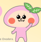
Illustration © Kie Onodera.