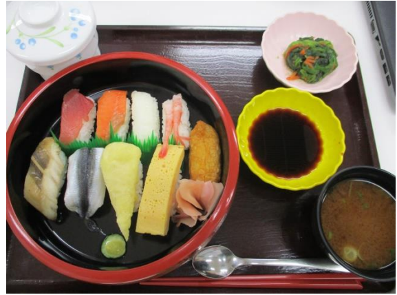
寿司おけが豪華さを演出しますね。