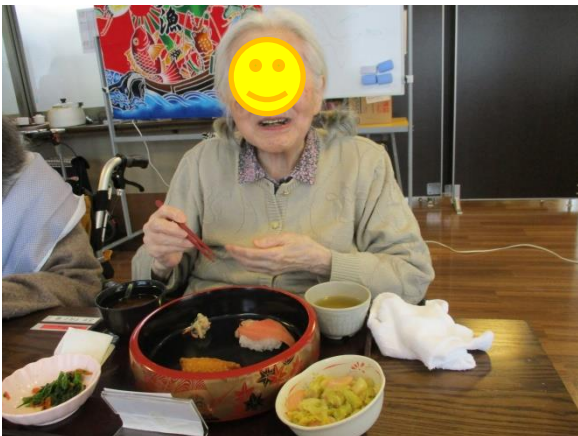
お腹いっぱい。こちらも笑顔です。