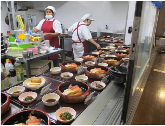
厨房さんの協力のもとお寿司をご提供。