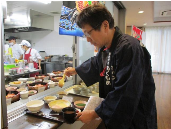
元気に「握り寿司 一丁、入りま〜す。」