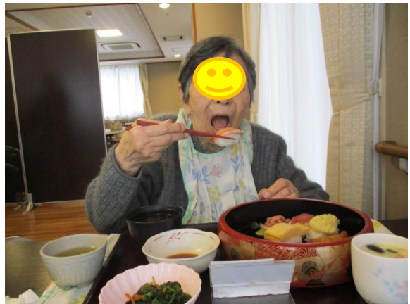
好きなものは大きな一口でも大丈夫。