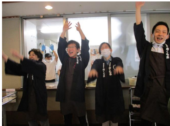
頑張った職員さん達に → グッジョブです。

頂戴した声「日頃から回転寿司でも行きたいね、と言っていたのでまさかお寿司が食べられるなんて驚きました。」