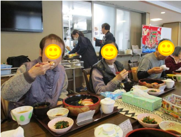
大きいね。自然に笑顔になります。